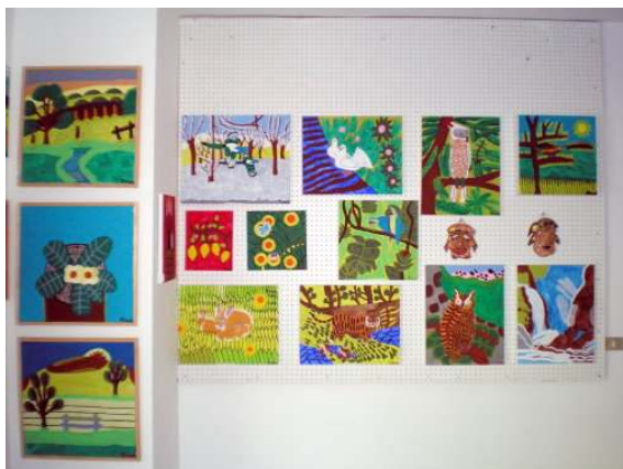
Particolare della mostra permanente di pittura ad ingresso libero