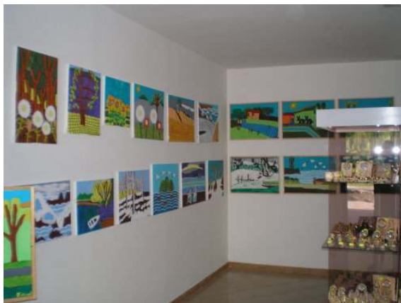
Angolo del negozio con la mostra di pittura e vetrine centrali.